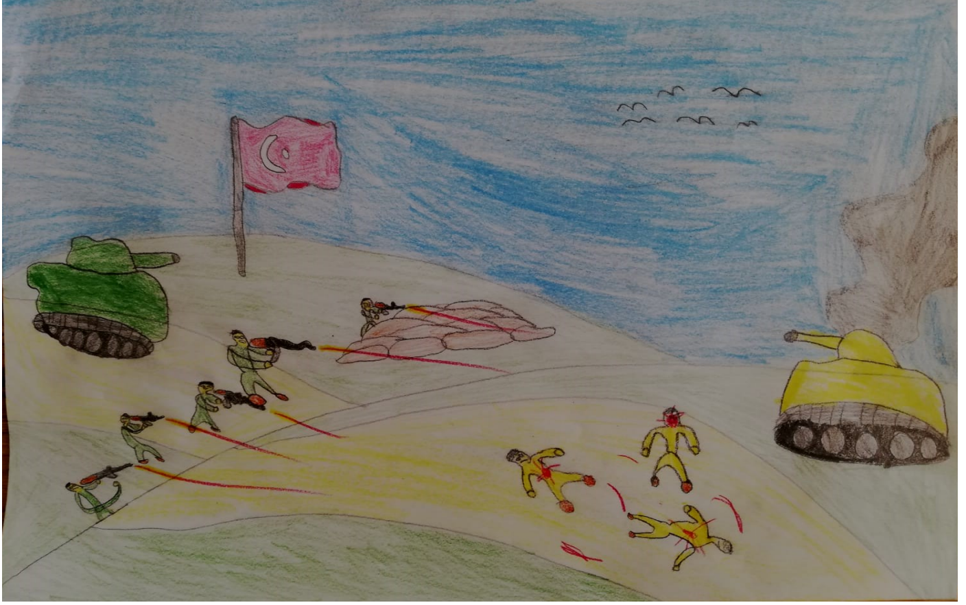
EYMEN İLHAN 3/C SINIFI